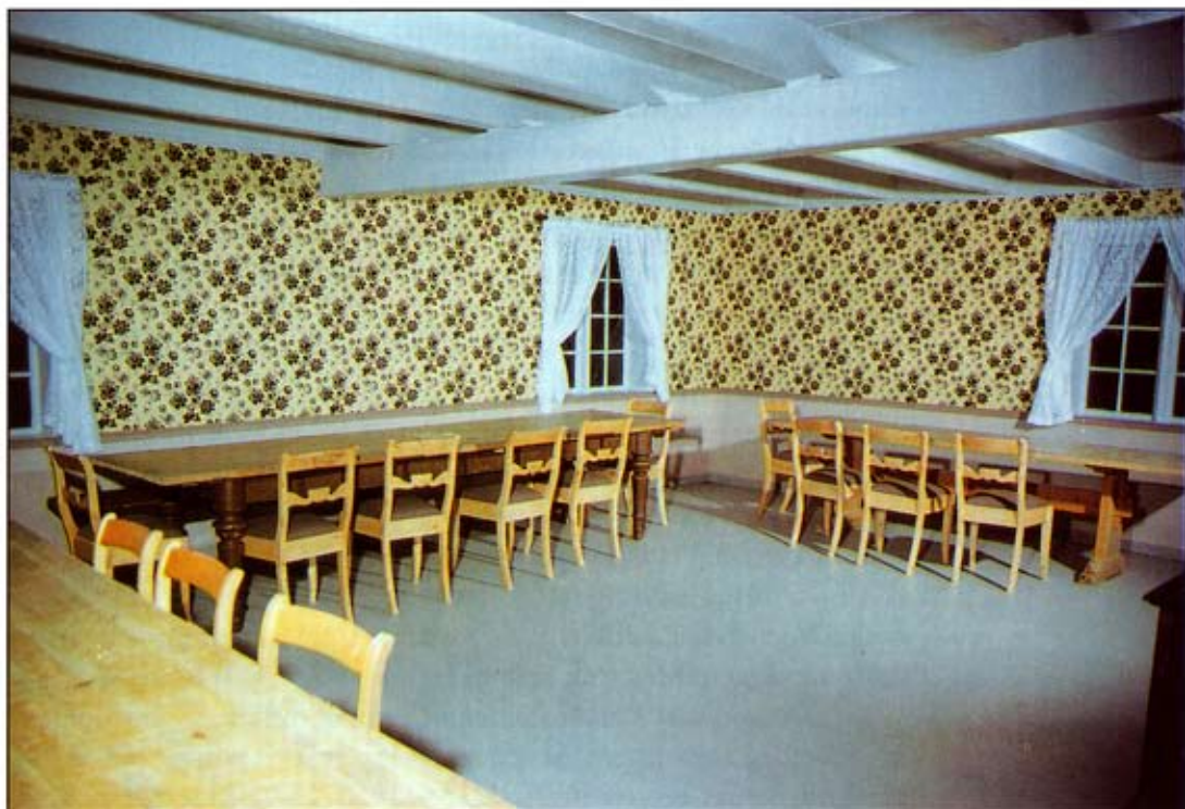
Kammeret (venstre side) og Herresalen - to rom som fortel historie utan ord. Kammeret står slik det var da Raulåna vart teken i bruk, og har ein sterk atmosfære av 1600-tal og barokk, mens Herresalen viser kva som var tidsriktig dekor for hundre år sidan.

mannen inn, og forærte av eiga lomme ein rund sum til prosjektet. Til vederlag fekk sponsoren ei minneplate, som den dag i dag heng over inngangsdøra, med denne inskripsjonen: